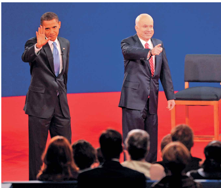
Нашвилль. 8 октября. Кандидат в президенты США от демократической партии Барак Обама и кандидат от республиканцев Джон Маккейн во время предвыборных теледебатов.

Обама завершил визит в Европу, преодолевая культурные барьеры — встречаясь с иудейскими, христианскими и мусульманскими лидерами, снимая обувь для осмотра древних мечетей и призывая молодёжь «строить новые мосты вместо новых стен» по всему миру. «Вашингтон Пост», 7 апреля 2009 г.