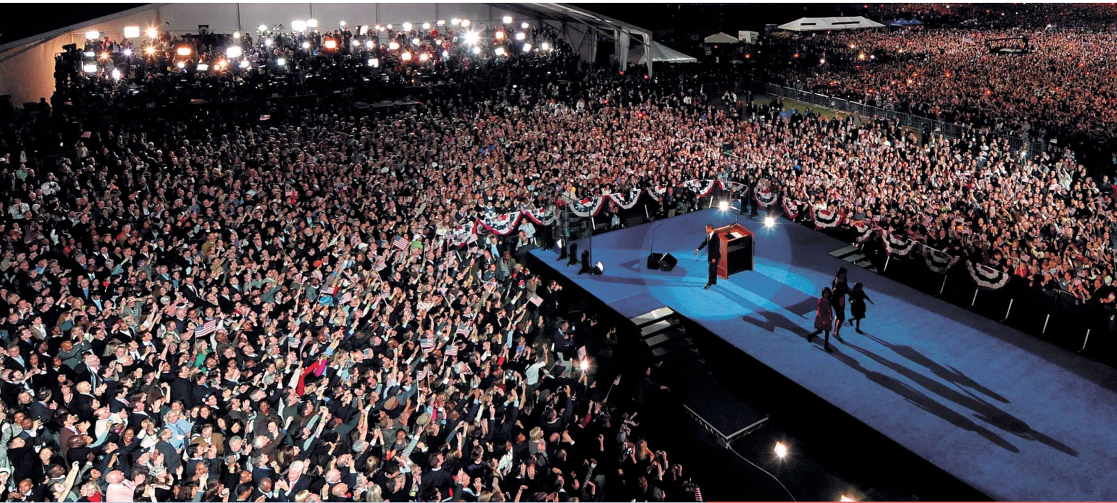
Чикаго. 5 ноября. Во время обращения к избирателям избранного президента США Барака Обамы в Парке Гранта.

«Мир будет таким, каким вы его сделаете», — сказал Обама на одной из официальных встреч, подчеркнув, как и прежде, растущий потенциал молодёжи в деле изменения мировых политических механизмов и политических курсов. «Вашингтон Пост», 7 апреля 2009 г.