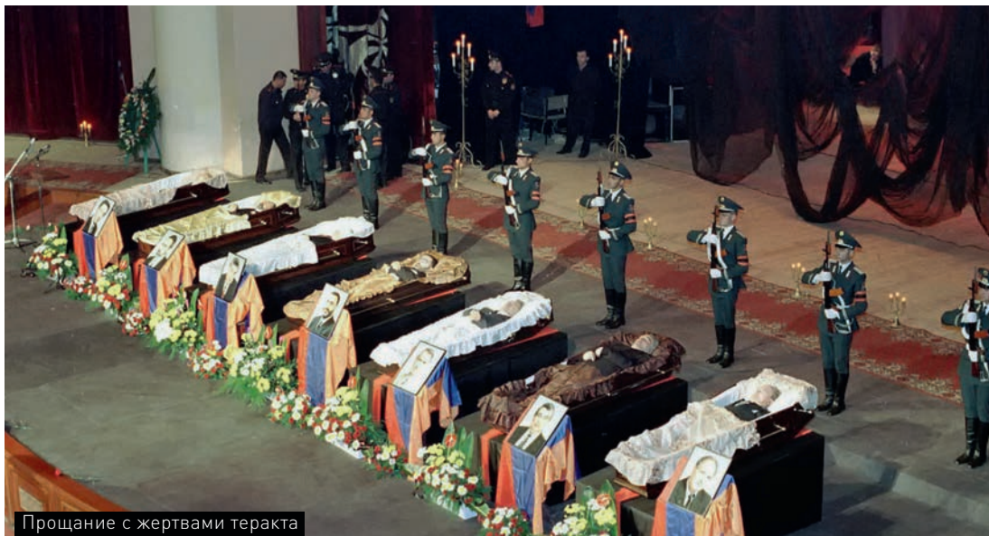
Прощание с жертвами теракта