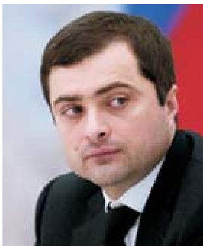
Владислав Сурков — Первый заместитель главы администрации президента

участник Ярославской международной конференции