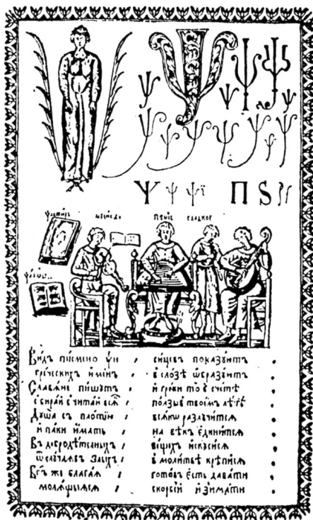
Страница из букваря К. Истомина

Второе относится к вопросу об одном из обя-