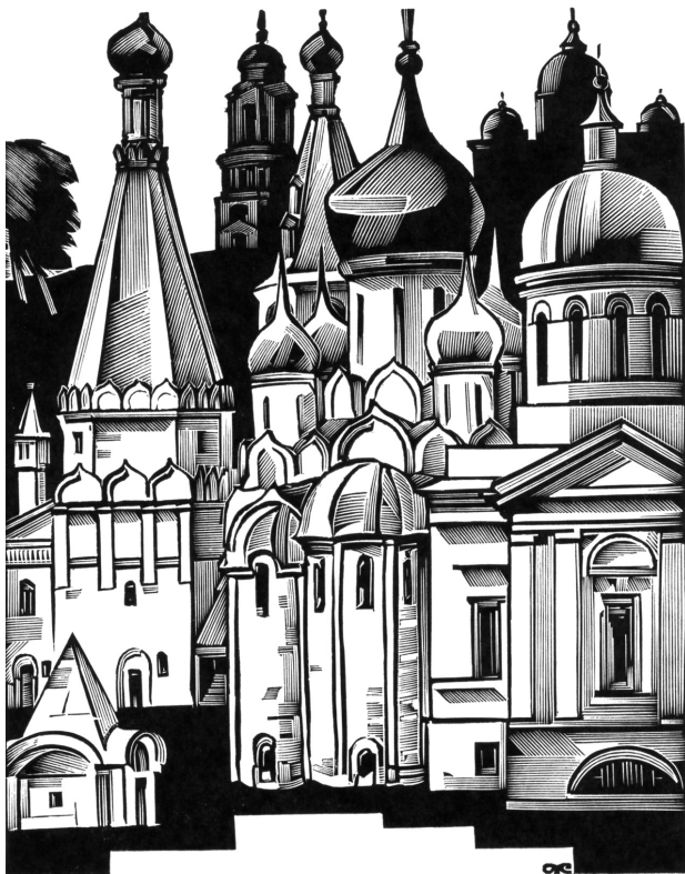
Старица. Монастырь. Художник А.И. Калашников

зывается новая методология социального и трансдисциплинарного знания — положение дел, которое инициирует фундаментальные исследования в этой сфере. Но мы оказываемся перед лицом не только серьезного интеллектуального вызова — ведущаяся сегодня гонка в сфере методологии (и технологий) принятия эффективного решения, может оказаться не менее серьезной, чем происходившая в свое время гонка за высадку первого человека на Луну. Вопрос, между тем, не только в том, кто окажется победителем в этой гонке, но и кто является ее участником.