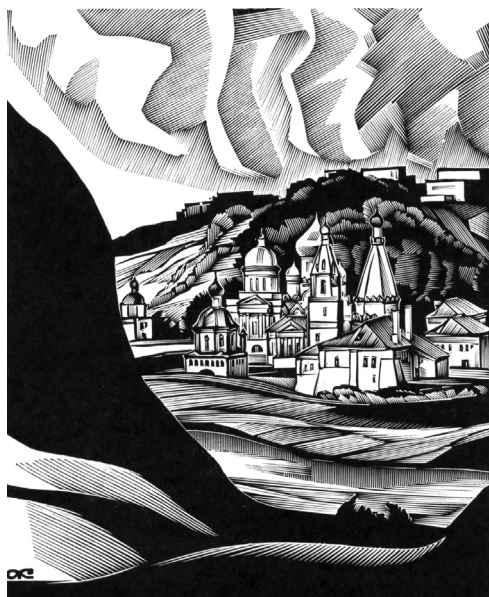
Древние валы Старицы. Художник А.И. Калашников

В заключение несколько слов о применении математических методов в гуманитарных науках. Я несколько лет работал в сфере их применения в градостроительстве и планировке. Могу сказать, что мы тогда столкнулись с абсолютной неподготовленностью этой сферы жизни к применению новых методов. Опыт говорит, что математизации должны предшествовать гипотезы на гуманитарной основе функционирования деятельности людей в интересующей нас области. Без этого математика лишена основы для применения, во всяком случае, на современном уровне. Следует также учитывать слабую способность собирать необходимый минимум информации, необходимый для эффективной математизации.