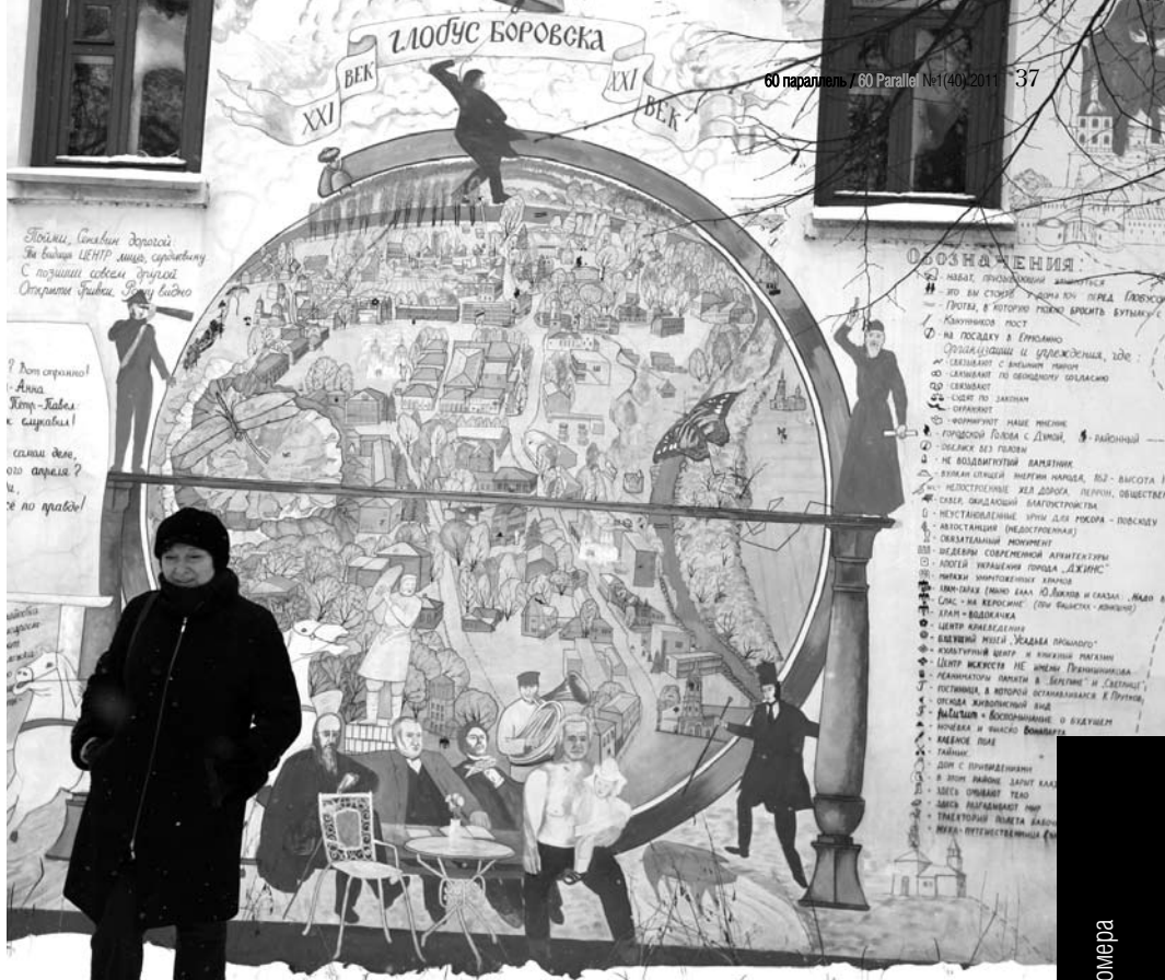
Точки интереса могут быть оформлены с юмором. Настенная фреска «Глобус Боровска». Художник Владимир Овчинников.

шансов на получение билета в цивилизованное общество.