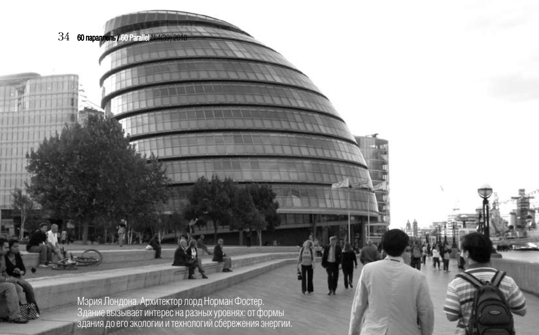
Мэрия Лондона. Архитектор лорд Норман Фостер. Здание вызывает интерес на разных уровнях: от формы здания до его экологии и технологий сбережения энергии.